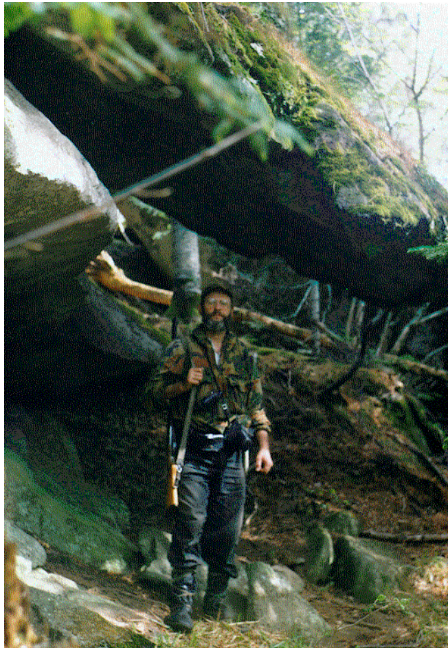
Фото 4. Нависающие глыбы останцов «Тигрового Дома».