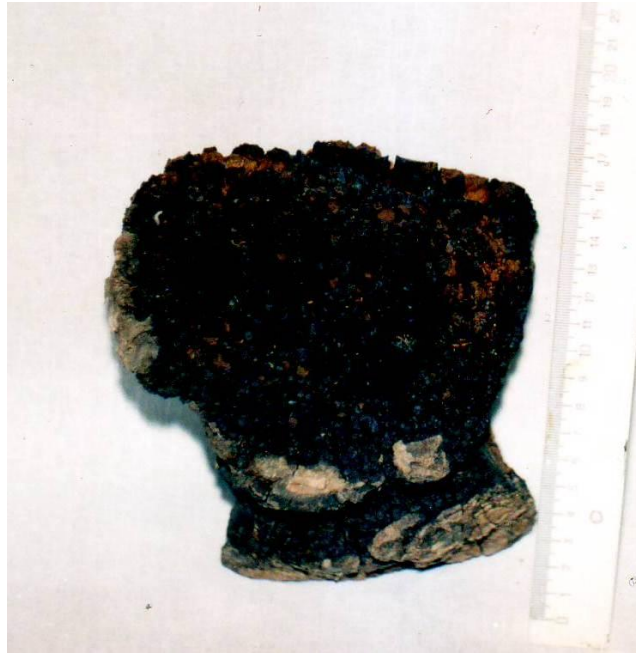
Фото 3. Фигурка головы медведя - «хозяина тайги», вырезанная из гриба чаги. 1993 г.